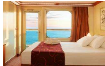
Slike kabina informativnog su karaktera.

Nadopлата za korištenje dvokrevetne kabine kao JEDNOKREKETNE – isključivo na upit Broj višekrevetnih kabina prema ovim uvjetima je ograničen.