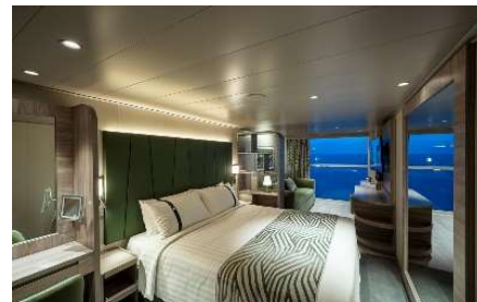
Slike kabina informativnog su karaktera.

CIJENA UKLJUČUJE: smještaj u odabranoj kabini tijekom krstarenja (tuš/WC, klima uređaj, sef, sušilo za kosu, TV), 8-dnevno krstarenje prema programu, prošireni puni pansion na brodu, animacija, zabavni večernji program u salonima i barovima sa živom glazbom, predstave u kazalištu, sportske aktivnosti, korištenje fitness dvorane, bazena, ležaljki, knjižnice, ukrcaj i iskrcaj prtljage, pratnja Globtour Event pratitelja putovanja (za minimalno 30 putnika), trošak organizacije i jamčevinu.